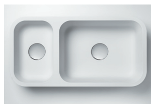
Cuba 873 823 x 399 x 115/191 mm