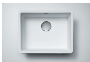
Cuba 970 L 530 x 400 x 175 mm