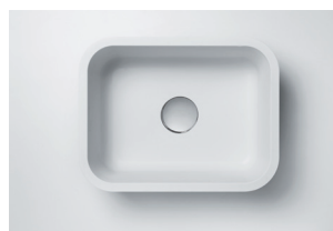
Cuba 871 531 x 397 x 188 mm