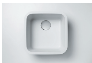
Cuba 804 399 x 399 x 208 mm