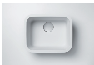
Cuba 859 440 x 340 x 200 mm

As cubas e os lavatórios fabricados pela DuPont estão disponíveis na cor Glacier White. São modelos versáteis que atendem desde cozinhas e banheiros de residências até hospitais, restaurantes e hotéis. Quando colados em tampos, também de Corian®, o acabamento fica perfeito, parecendo uma única peça. Integrados, as cubas e os lavatórios não formam frestas, o que evita o acúmulo de sujeira e água, facilitando a limpeza e a higiene. Outras opções de formato e cor podem ser fabricadas, sob medida, por processadores autorizados DuPont™ Corian®.