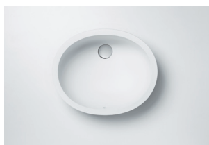
Lavatório 810 418 x 332 x 138 mm