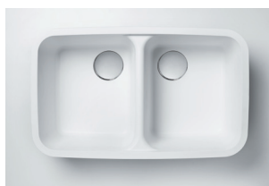
Cuba 850 734 x 423 x 227 mm