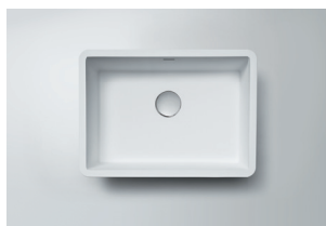
Lavatório 4530 L 450 x 300 x 110 mm